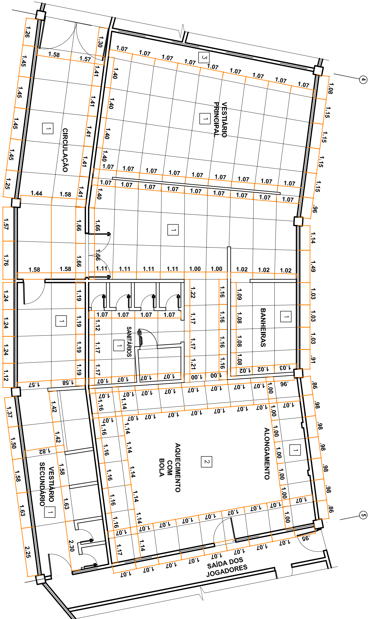
PLANTA BAIXA PAGINAÇÃO PISO